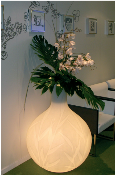
Réf. 134.300B - Bac Princess Light Ø 75 cm ht 1 m avec Orchidées et feuillages