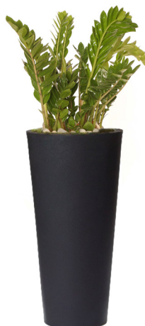
Réf. 113.410 B - Zamioculcas en bac Partner noir ht totale 1,30 à 1,50 m