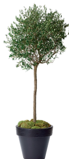
Réf. 112.020 - Olivier Réf. 134.359 - Vase three noir