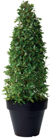
Réf. 112.135 - Laurier cône ht 1,50m Ø40/50cm Réf. 134.359 - Vase three noir

At Gally, we pride ourselves with the reputation of our presentations of both popular and exotic plant selections, presented in standard or tailor-made containers and designed to suit all tastes and decors. The objective is never to clash with or change the existing environment. Our specialists seek to create floral displays that blend with, and enhance, the beauty of the existing colour schemes and atmosphere.