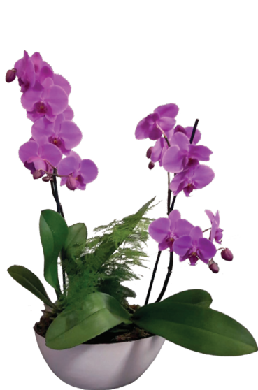
Réf. 182.200 - Coupe fleurie Ø 30 cm