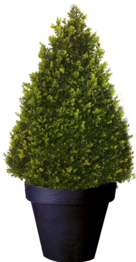
Réf. 111.140 - Buis cône Ø 50 cm ht 1 à 1,20m Réf. 134.359 - Vase three noir