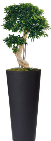
Réf. 113.410 A - Bonsaï ficus nitida en bac Partner noir ht totale 1,20 à 1,50 m

No floral selection or composition is beyond the capability or creativity of our master gardeners. We guarantee to find the right arrangements for you.