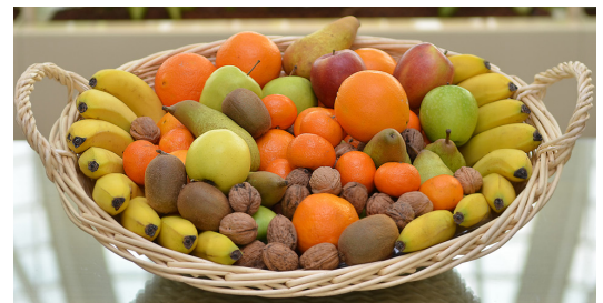
Réf. Pofruit 10K