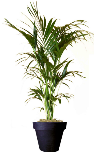
Réf. 113.200 - Kentia ht 1,80 à 2m Réf. 134.359 - Vase three noir