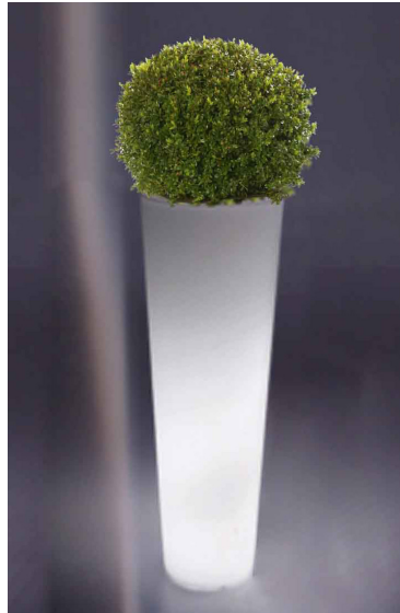
Réf. 134.326A - Bac PVC New Pot Maxi light Ø 44 cm ht 1,20 m avec buis boule Ø 45 cm