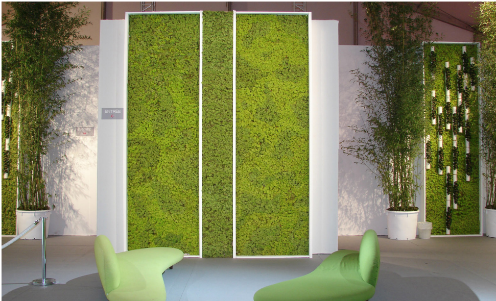
Tarifs sur devis