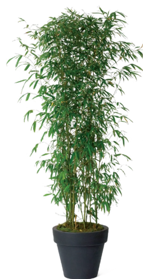
Réf. 111.110 - Bambou touffe ht 1,50 à 2 m Réf. 134.359 - Vase three noir