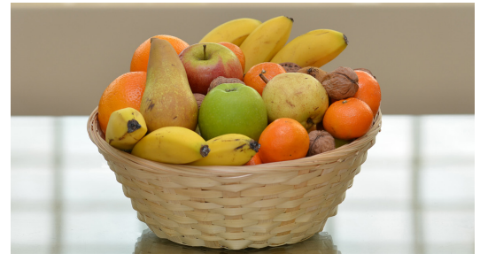
Réf. Pofruit OSK