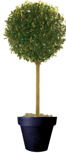
Réf. 112.160 - Laurier tige boule ht 1,80m Ø60cm Réf. 134.359 - Vase three noir