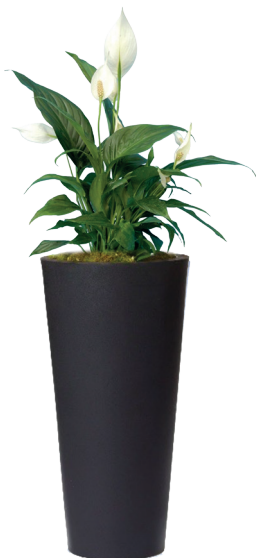
Réf. 113.300A - Spatiphyllum sensation en bac Partner noir ht 1,80 à 2 m