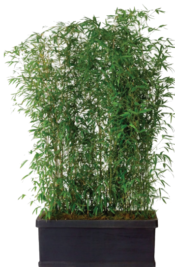
Réf. 142.960 - Bac rectangle noir 100 x 32 cm Haie de Bambous ht 2 à 2,50 m