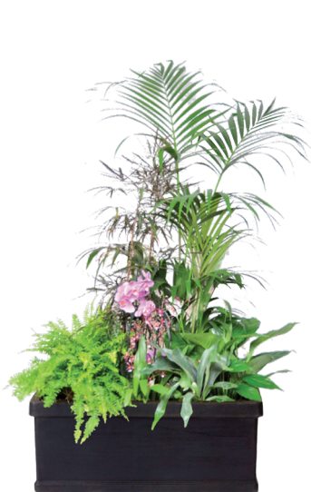
Réf. 143.200 - Bac rectangle noir 100 x 32 cm Composition de végétaux