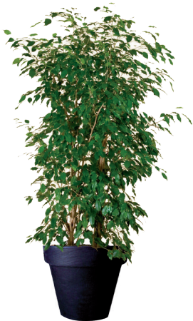
Réf. 113.160 - Ficus ht 1,80 à 2m Réf. 134.359 - Vase three noir