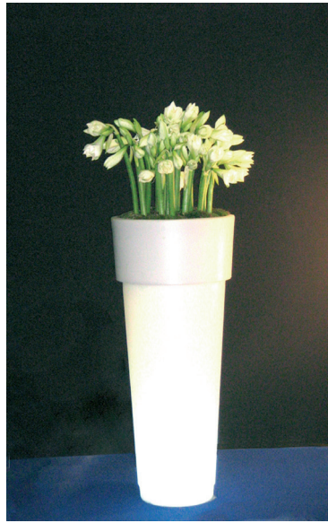
Réf. 134.320A - Bac Marcantonio light Ø 50 cm ht 1,20 m avec Amaryllis blancs

The Gally Design Centre is staffed by knowledgeable and innovative experts who are ready to respond to every customer request. Whether a standard selection or a bespoke solution, our master gardeners guarantee an unsurpassed level of professional advice, project execution and customer satisfaction.