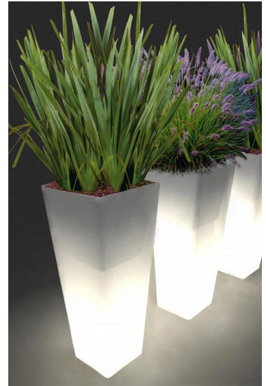
Réf. 134.327A - Bac PVC Kubis ASQ light 46 x 46 cm ht 1,10 m avec Phormiums