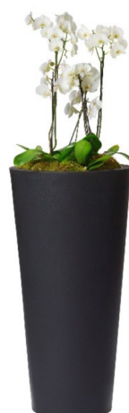
Réf. 113.410 C - Orchidées en bac Partner noir ht totale 1 à 1,10 m