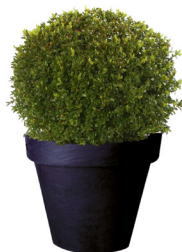
Réf. 111.125 - Buis boule Ø 35/40 cm ht 0,50m Réf. 134.359 - Vase three noir