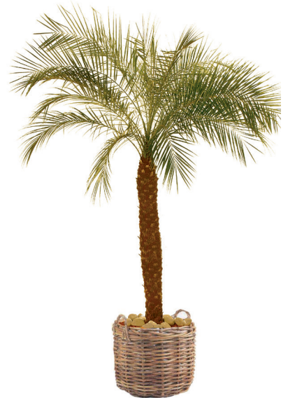
Réf. 113.230 - Phoenix roebelinii ht 1,80 à 2,10m Réf. 136.300 - Vannerie osier