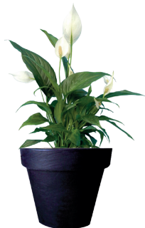
Réf. 113.310 - Spatiphyllum Sensation ht 1,20 à 1,50m Réf. 134.359 - Vase three noir