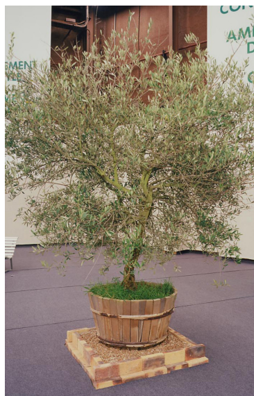
Réf. 122.160 - Olivier vieux tronc Ø 1,50 m ht 2,50 à 3 m