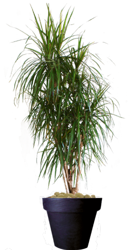
Réf. 113.130 - Dracaena maginata ht 1,80 à 2m Réf. 134.359 - Vase three noir