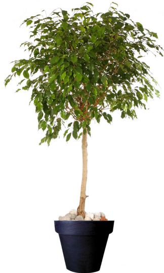
Réf. 123.220 - Ficus tige boule Ø1,20/1,50m ht 2,50 à 3m Réf. 134.359 - Vase three noir