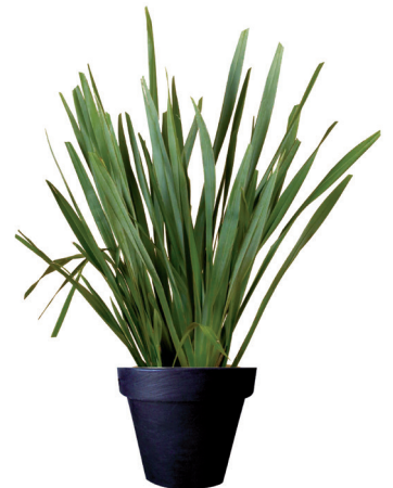
Réf. 112.300 - Phormium ht 1,20 à 1,50m Réf. 134.359 - Vase three noir