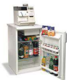
Réfrigérateur 140L Garni + distributeur FAMILY SAECO