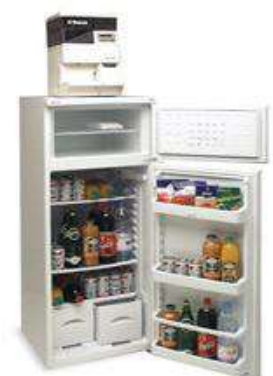
Réfrigérateur 280L Garni + distributeur SUPER AUTOMATICA SAECO SAECO