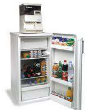
Réfrigérateur 220L Garni + distributeur SUPER AUTOMATICA SAECO SAECO