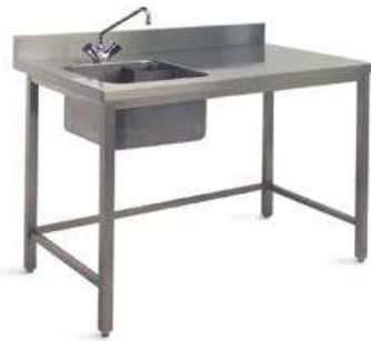
Table adossée sans étagère