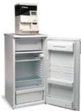
Réfrigérateur 220L + distributeur SUPER AUTOMATICA SAECO SAECO