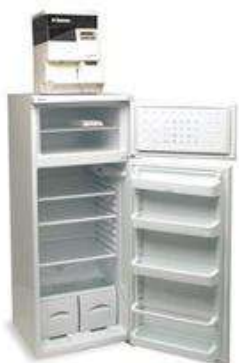
Réfrigérateur 280L + distributeur SUPER AUTOMATICA SAECO SAECO